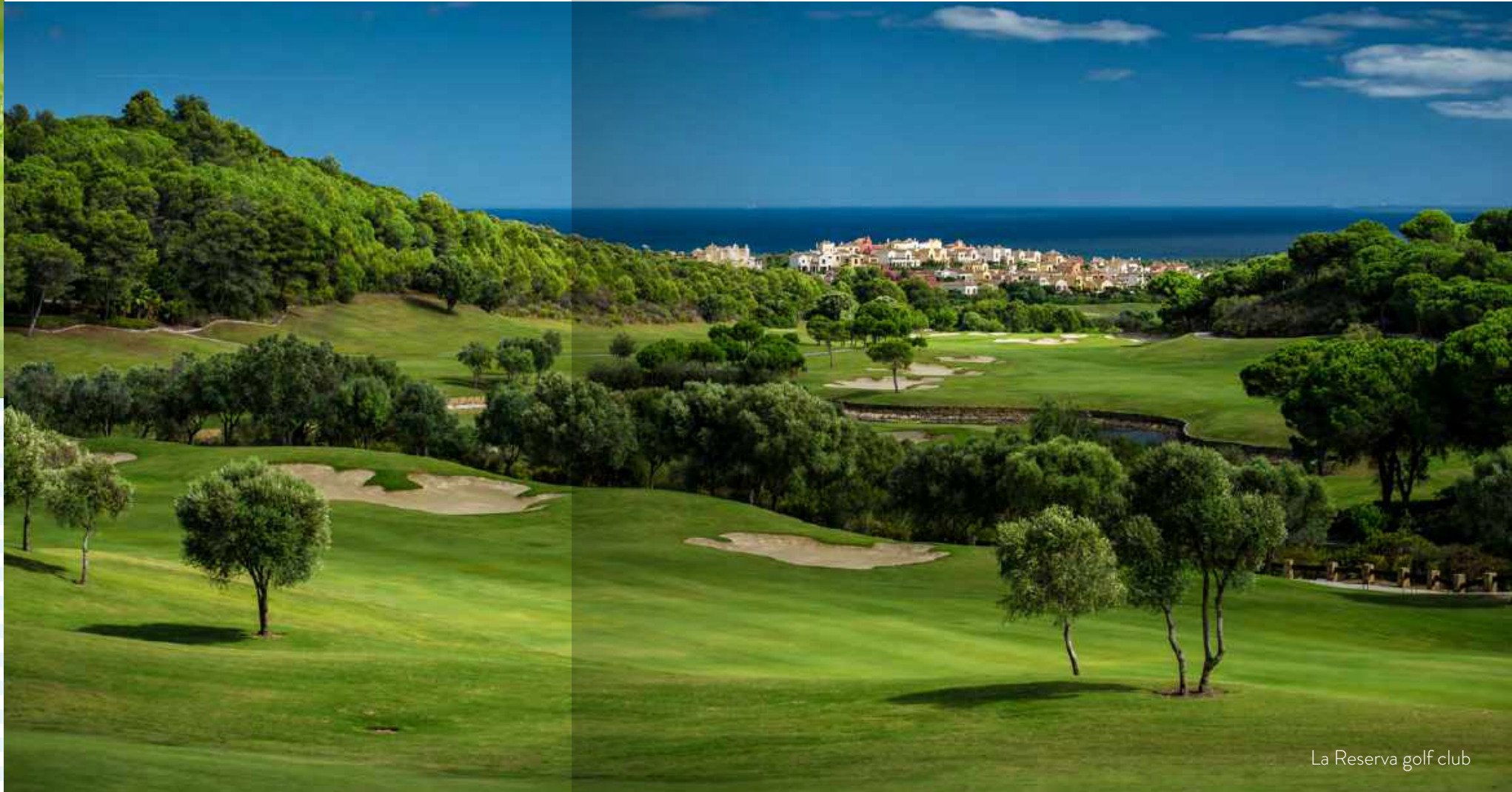
La Reserva golf club

A pocos minutos encontramos Estepona Golf, con increíbles vistas al mar y otros campos de golf de renombre internacional están a unos 15 minutos, dirección oeste como Valderrama, La Reserva, y dirección este a 20 minutos, el famoso valle del golf, en Marbella.