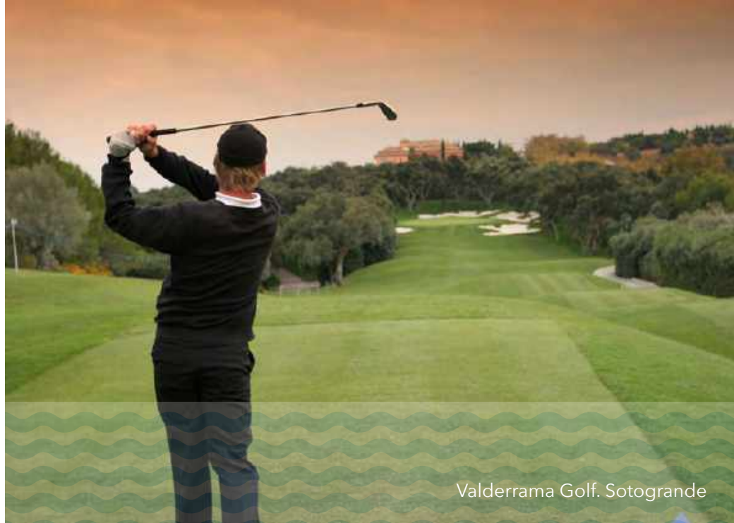
Valderrama Golf. Sotogrande